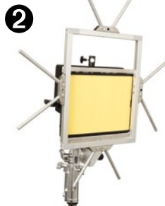
GOBOHEAD HOLDER HALTER