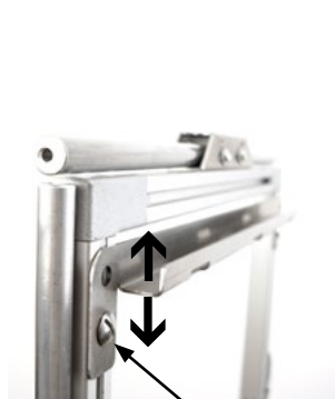
clamping screw / Klemmschraube